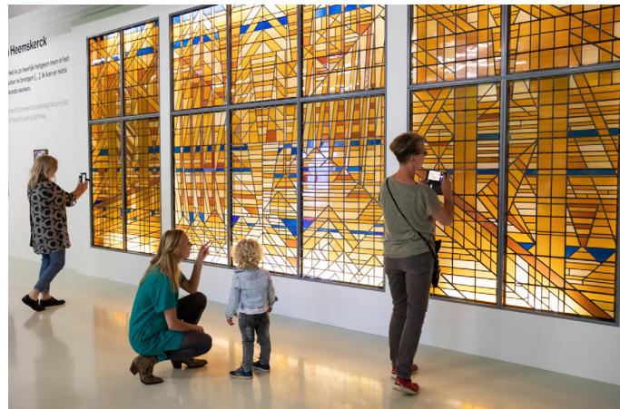
Werk van Jacoba van Heemskerck in de tentoonstelling Meesterlijke vrouwen .

De kunstwereld is nog altijd een jongensclub. Slechts 13% van de kunst in Nederlandse musea is gemaakt door vrouwen, blijkt uit onderzoek van Mama Cash. Hoe beroemd sommige vrouwen ook waren, na hun dood werden ze uit de kunstgeschiedenis geschreven. Een flink aantal raakte in vergetelheid. De tentoonstelling Meesterlijke vrouwen bracht daar verandering in. Daar was 100% vrouw. Deze