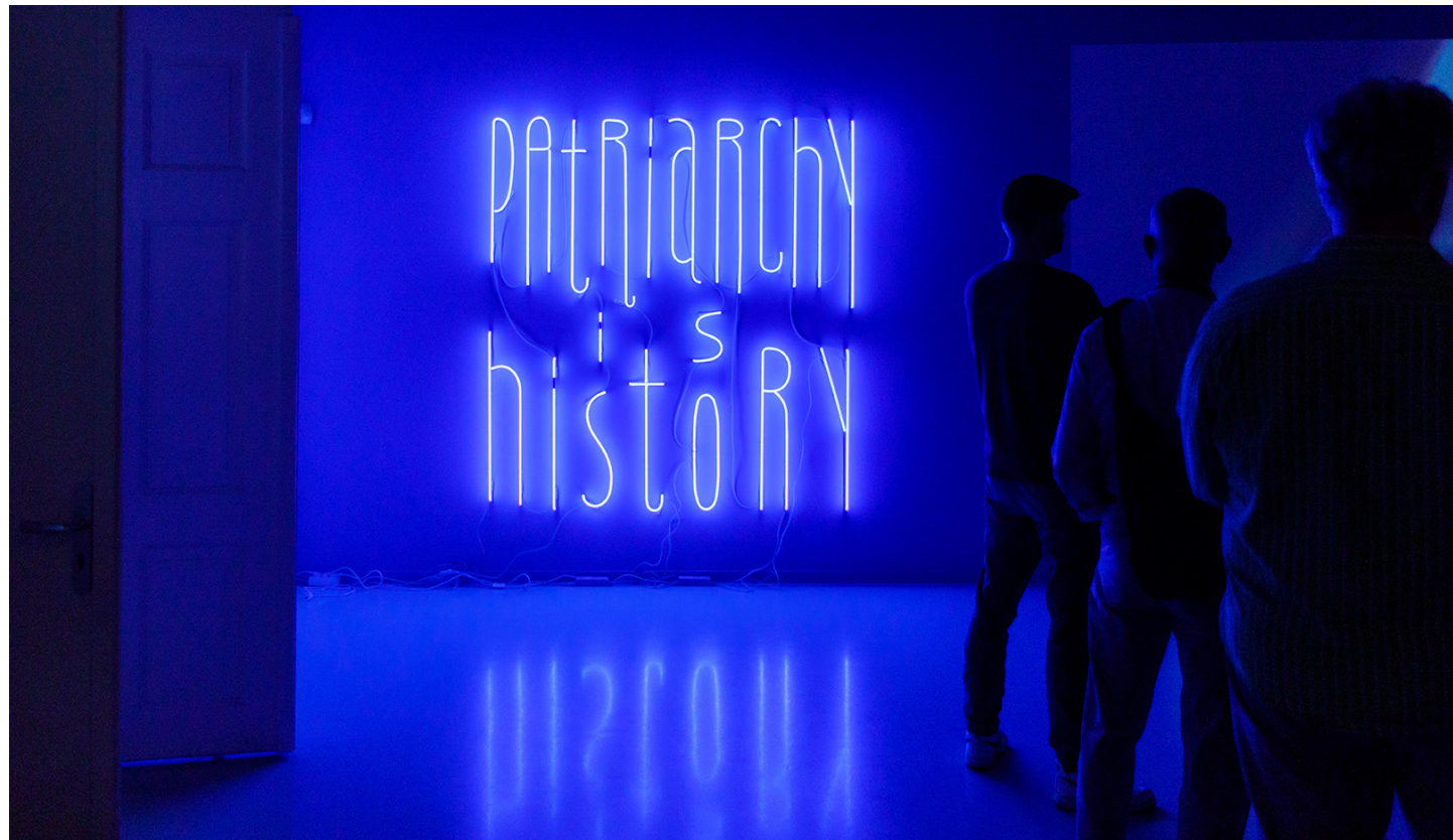
Yael Bartana, Patriarchy is History, 2019. Aankoop collectie Stedelijk Museum Schiedam en SCHUNCK.