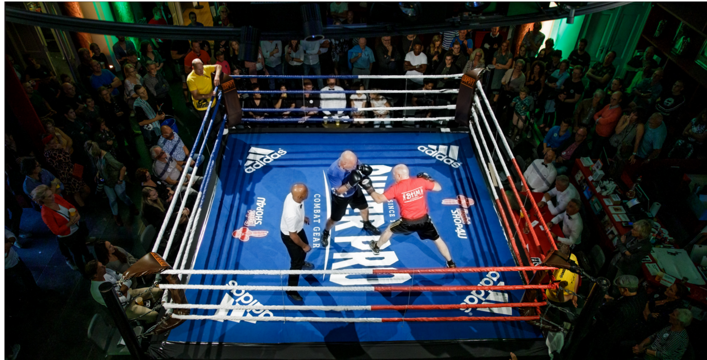
Boksvereniging De Haan Memorial weekend.

Studenten MBO Zorg bezochten de tentoonstelling Ma en spraken daar over de verschillende brillen die je op kunt zetten als het gaat om zorg voor een ander. Bij Modest Fashion werd voor MBO-studenten het programma Met andere ogen aangeboden. De tentoonstelling leende zich goed voor kritische gesprekken, die werden geoefend aan de hand van stellingen en rollenspellen.