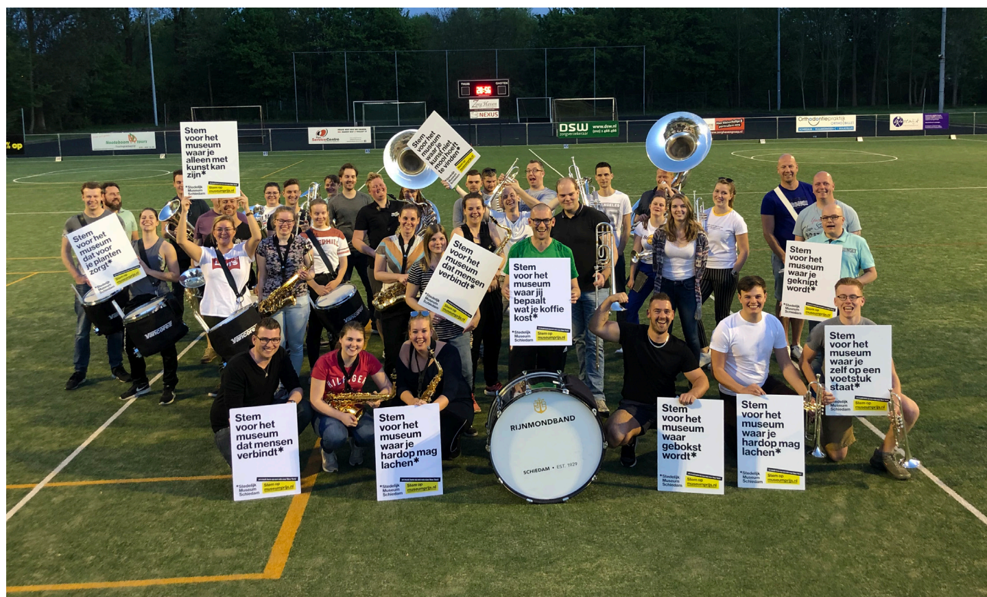
De Rijnmondband steunt ons.