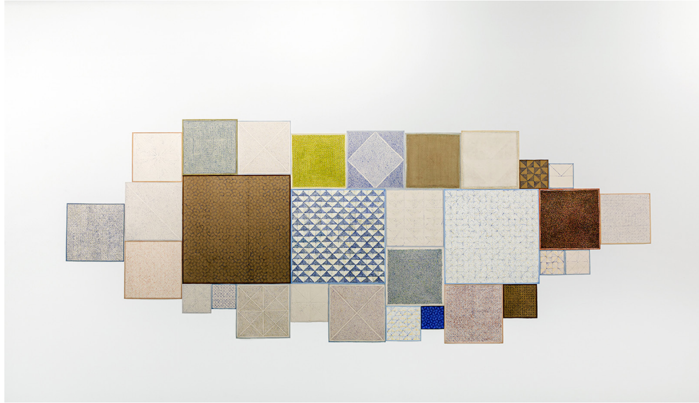
Fatima Barzge, Study of Square/Zamzam, 2017. Aankoop collectie NOG.