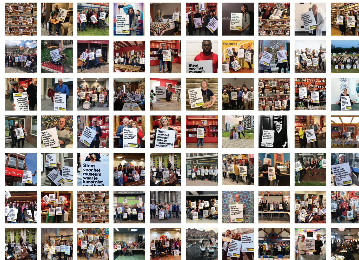
Veel mensen deden mee aan de actie en gingen met een bord op de foto; bedankt!