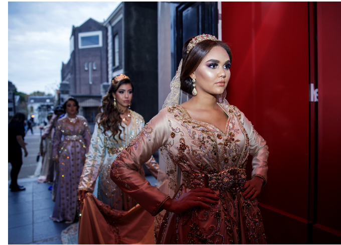
Modest Fashion Fair.