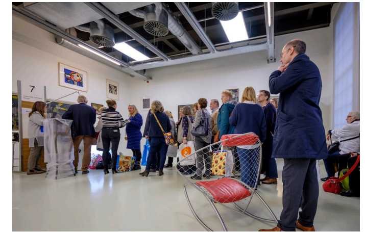
Tussen Kunst & Kitsch.

de waarde van de meegebrachte werken bepalen. Er werden mooie vondsten gedaan en in september was de televisie-uitzending.