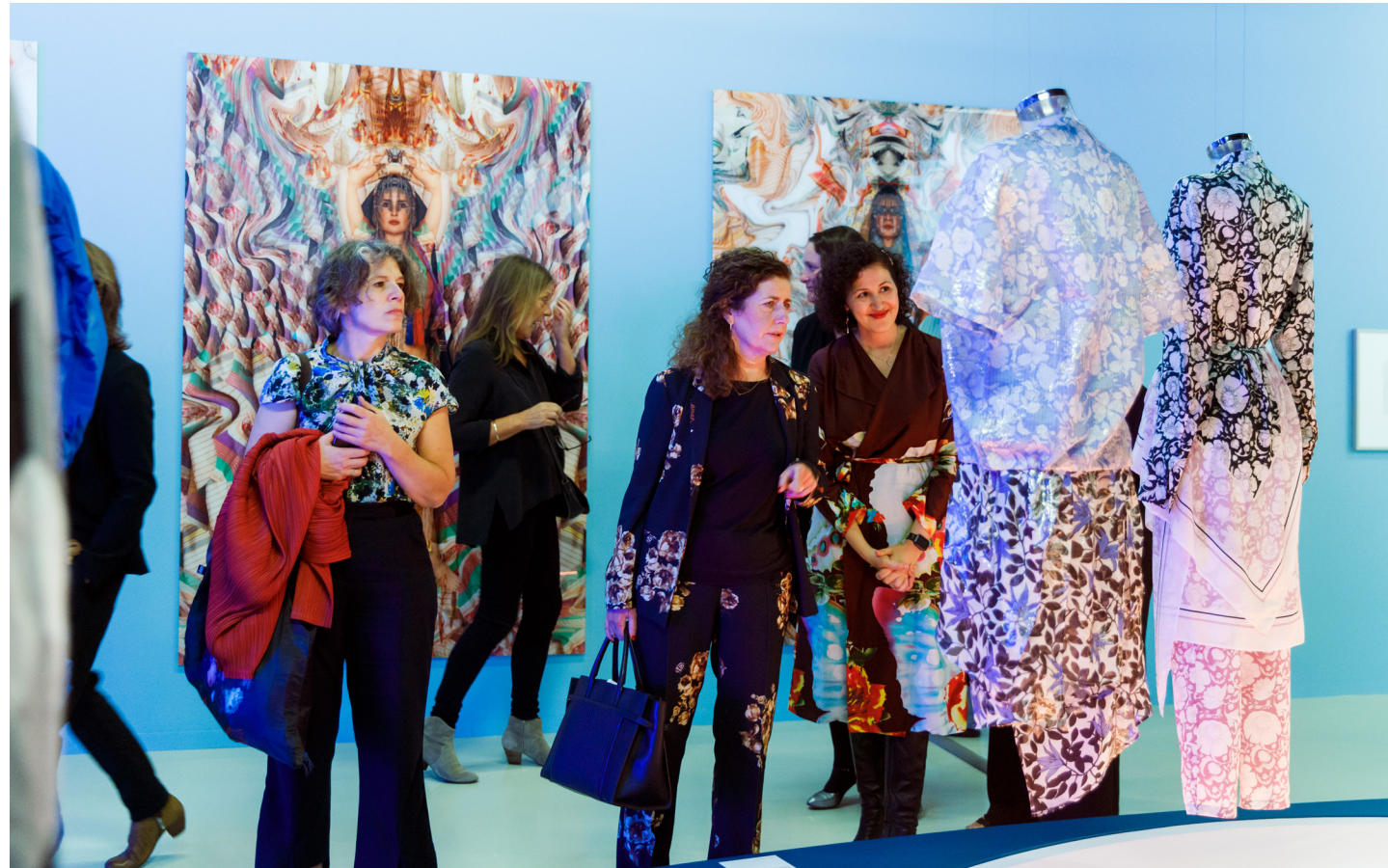
Modest Fashion.