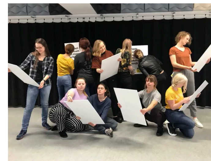
De Stokerij steunt ons