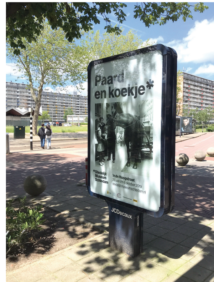
Paard en koekje, affiches in Schiedam voor de tentoonstelling In de Hoogstraat .