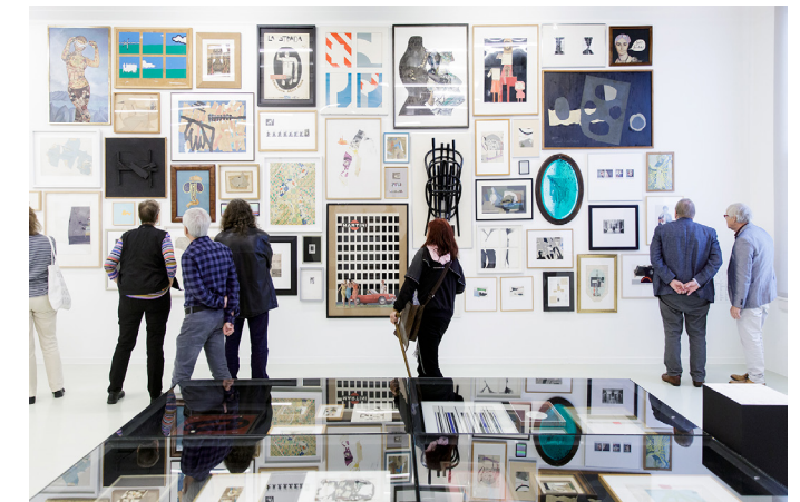
Magische collages.

In Magische collages werden collages getoond uit de collectie van Geert Verbeke en Carla Lens. Zij brachten hun collectie onder in hun private Stichting de Verbeke Foundation in het Vlaamse Kemzeke. Wereldwijd is het de meest complete en representatieve collectie op het gebied van collages. Niet eerder lieten de verzamelaars zoveel werk buiten België zien.