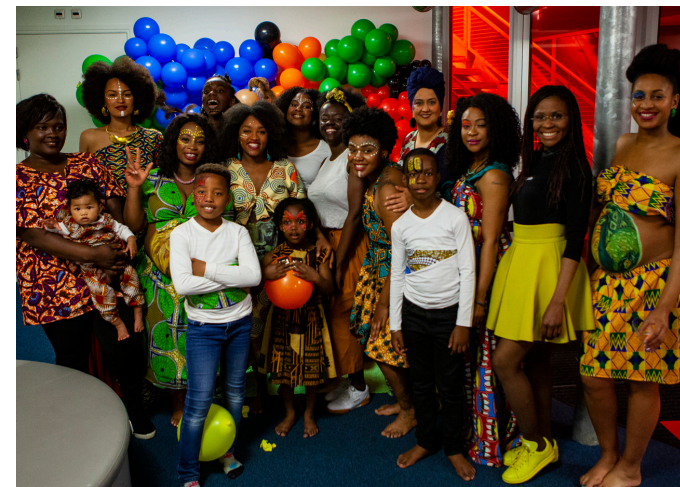
De Bellypaint Art & Fashion crew.

Afgelopen jaar hebben we vrijwel elk verzoek tot samenwerking gehonoreerd. Daarmee verbreedden we ons netwerk nog meer en lieten we zien wat Mijn Schiedam is en kan zijn. Van een Afrikaans mode- en kunstfeest ter ere van de zwangere vrouw, tot een Iftar (ramadan-maaltijd) en van een fantastisch modeltreinen kerstlandschap tot bokswedstrijd, van een tentoonstelling van twee scholieren tot een herinnerboom met de lokale uitvaartbegeleiding. Een overzicht hiervan vindt u in bijlage 2. In bijlage 1 kunt u lezen dankzij welke mensen al deze activiteiten werden gerealiseerd.