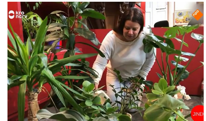
Onze plantvakantie komt langs bij het televisieprogramma Jinek, 2 aug 2019.