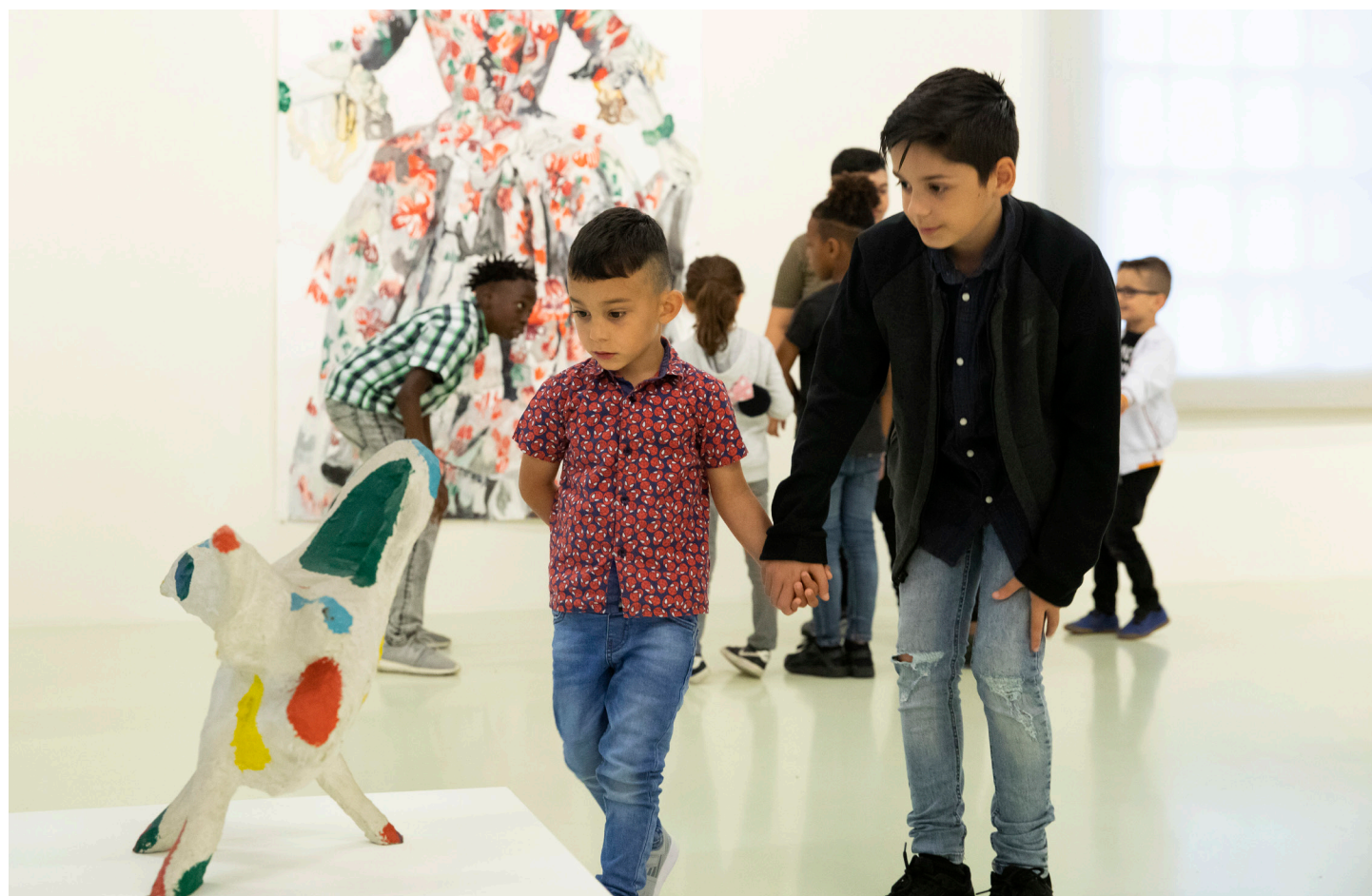
Het maatjesproject.

Een bijzondere samenwerking was die met de Dansmavo uit Schiedam. Tweemaal volgden de leerlingen een lesprogramma waarin zij geïnspireerd op een tentoonstelling in het museum zelf een choreografie ontwikkelden, die ze vervolgens live in de tentoonstellingszaal uitvoerden voor het museumpubliek.