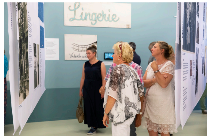
Bezoekers herkennen zich in de tentoonstelling In de Hoogstraat .

De Hoogstraat is een straat vol verhalen, van kabouter tot kinderwagen, van paard tot koekje. Het is een van de oudste wegen van Schiedam, een winkelstraat en een woonstraat.