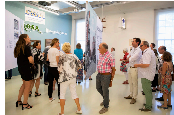
Bezoekers herkennen zich in de tentoonstelling In de Hoogstraat .

En bijna precies in het midden ligt het Stedelijk Museum Schiedam. De straat staat symbool voor veel winkelstraten in Nederland waar schaarste en overvloed, trends en tradities hun sporen na lieten. Het museum zette de straat in de spotlights met de tentoonstelling In de Hoogstraat . Verhalen uit een winkelstraat. Bijzonder was dat het publiek de tentoonstelling zelf kon aanvullen met foto's en andere spullen die aan de Hoogstraat herinneren. Speciaal voor deze tentoonstelling maakte kunstenaar Erik Mattijssen een tekening van 7.5 bij 3 meter. Bijna alles wat hij tekende, komt van de Hoogstraat, van drankfles tot dildo.