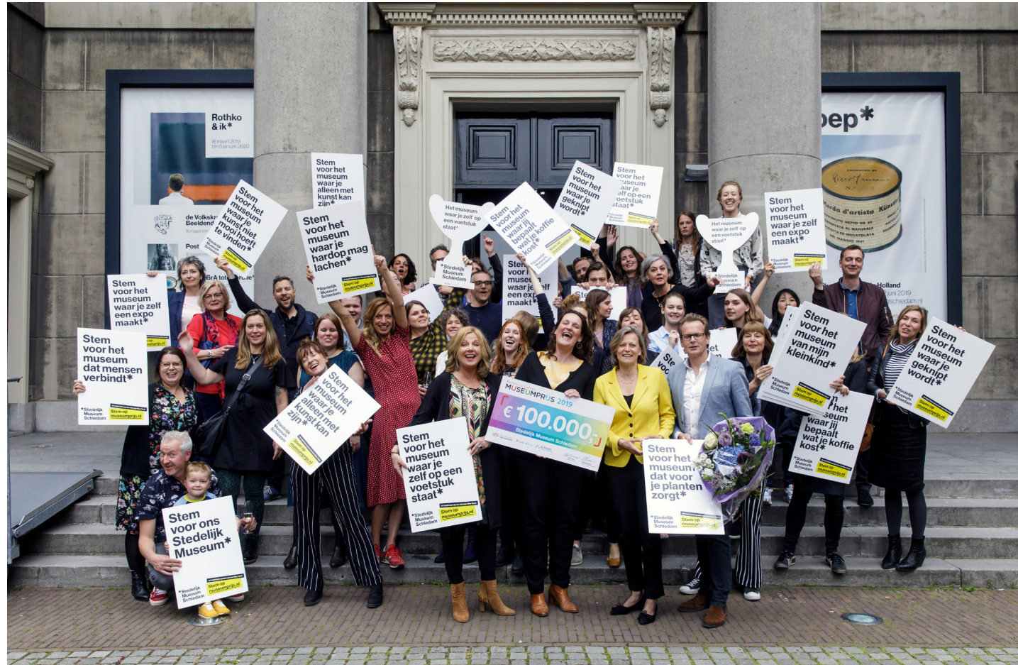
Het museum wint de BankGiro Loterij Museum Prijs 2019.

Het is in deze tijden van de coronacrisis je opeens nauwelijks meer voor te stellen: een museum vol leven. Nu thuis werkend denk ik met weemoed terug aan 27 december 2019, toen ik me in een hoekje van onze entree nestelde. Er kwamen die dag 368 bezoekers binnen. Je kon zien dat veel mensen zich in de sfeervolle kapel snel ontspanden, niet in het minst door de hartelijke ontvangst door de vrijwilligers en gastvrouwen. Het publiek kwam vaak voor één van de programma's, voor de mode en kunst in Modest Fashion , de collages van de Verbeke Foundation, de kerstschilderijtjes van Rien Poortvliet, om even alleen te zijn met Rothko of voor het Modeltrein Kerstfestijn . Maar daarna zwierven ze geïnteresseerd door de andere zalen, knutselden een kerstkaart op zolder, een treinwagonnetje in het souterrain of hingen een herinnering aan een dierbare in de kerstboom op het plein. Dit was een dag waarop het museum was zoals ons dat voor ogen staat: huiselijk, de wereld en de stad verbonden, met voor elk wat wils en vol mogelijkheden tot ontmoeting, reflectie en creativiteit.