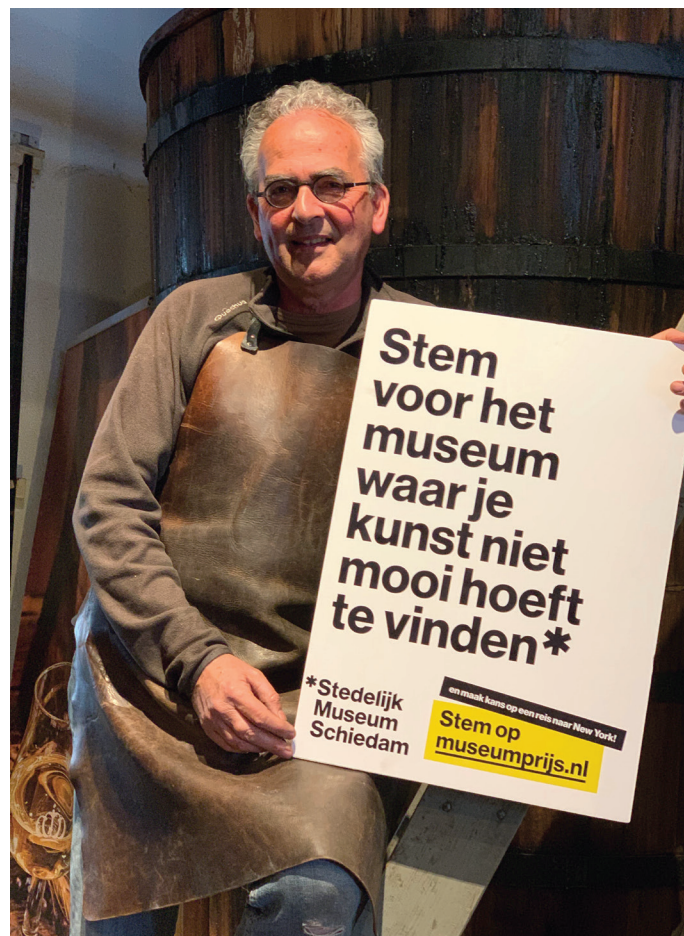
De brander van het Jenevermuseum steunt ons.