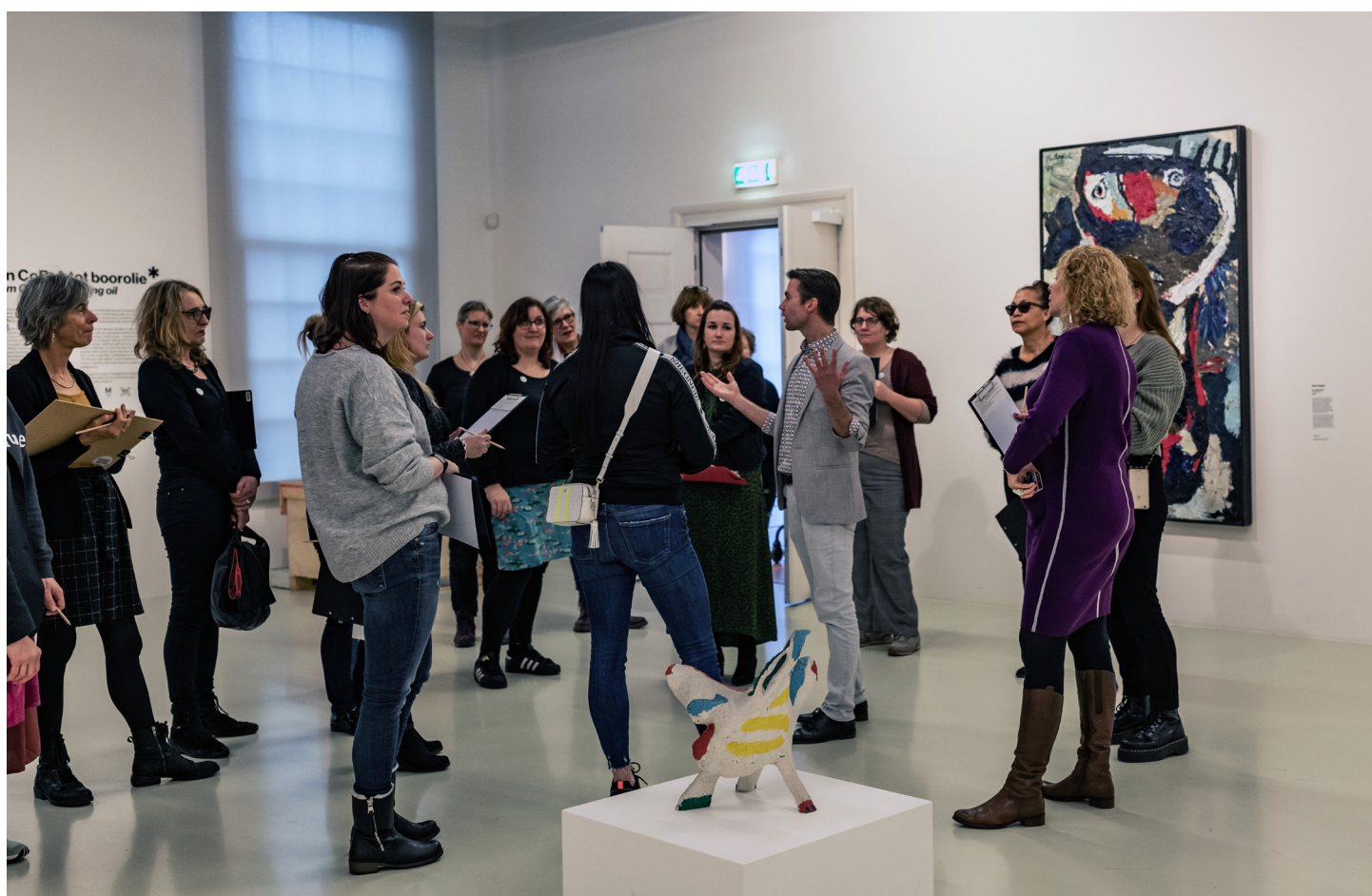
Leerkrachtensessie, samen met Mooi Werk.

De museumgidsen op zaal stonden op woensdag, zaterdag en zondag klaar op zaal voor een persoonlijke ontvangst. Ze gaven achtergrondinformatie over het museum, de kunstwerken en de tentoonstellingen.