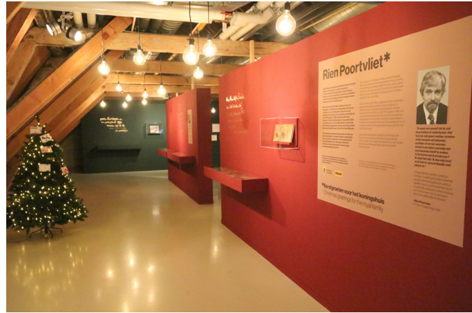
Kerstgroeten voor het koningshuis van Rien Poortvliet.

'Koninklijke Hoogheid, In plaats van een "hertje in de sneeuw" (dat ook erg mooi kan zijn!) heb ik voor U, omdat U zo dol op olifanten bent, een "olifantenwens" gemaakt'. Dat schrijft Rien Poortvliet op het schilderijtje dat hij in 1969 als kerstgroet stuurt aan prins Bernhard en koningin Juliana. Het werd het begin van een reeks kerstgroeten die hij elk jaar met de post verzond. Al die 24 schilderijtjes uit de collectie van het Koninklijk Huis waren rond de kerst te zien.