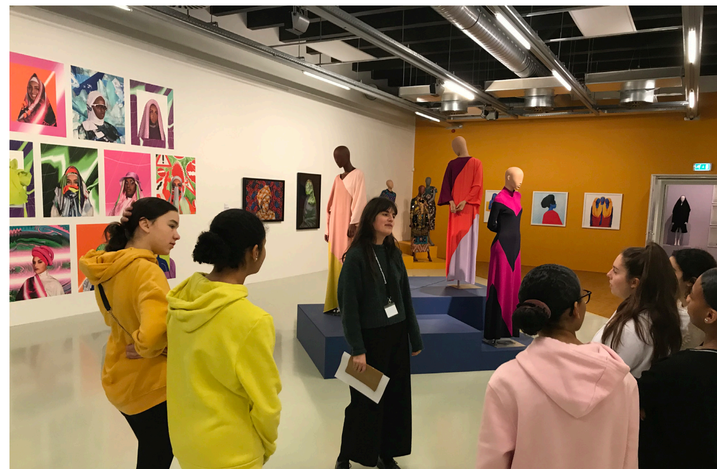
Leerlingen van het voortgezet onderwijs krijgen een rondleiding bij de tentoonstelling Modest Fashion .