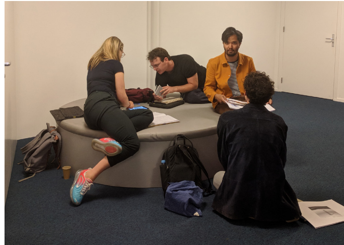
Jonge kunstenaars tijdens een activiteit rond de Volkskrant Beeldende Kunst Prijs.

en visie, waren er speeddates met kunstprofessionals en stond op de publieksdag de vraag centraal; voor wie maakt de kunstenaar zijn kunst?