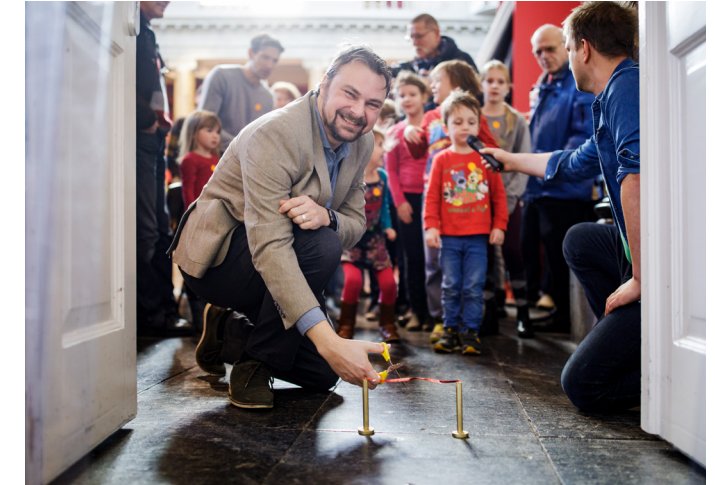
Opening Modeltrein Kerstfeestijn door wethouder Jeroen Ooijevaar.

Eind 2019 begon social designer Manon van Hoeckel als 'artist-in-residence' of zoals ze het zelf noemt 'joker'. Ze zal regelmatig interventies in het museum plegen.