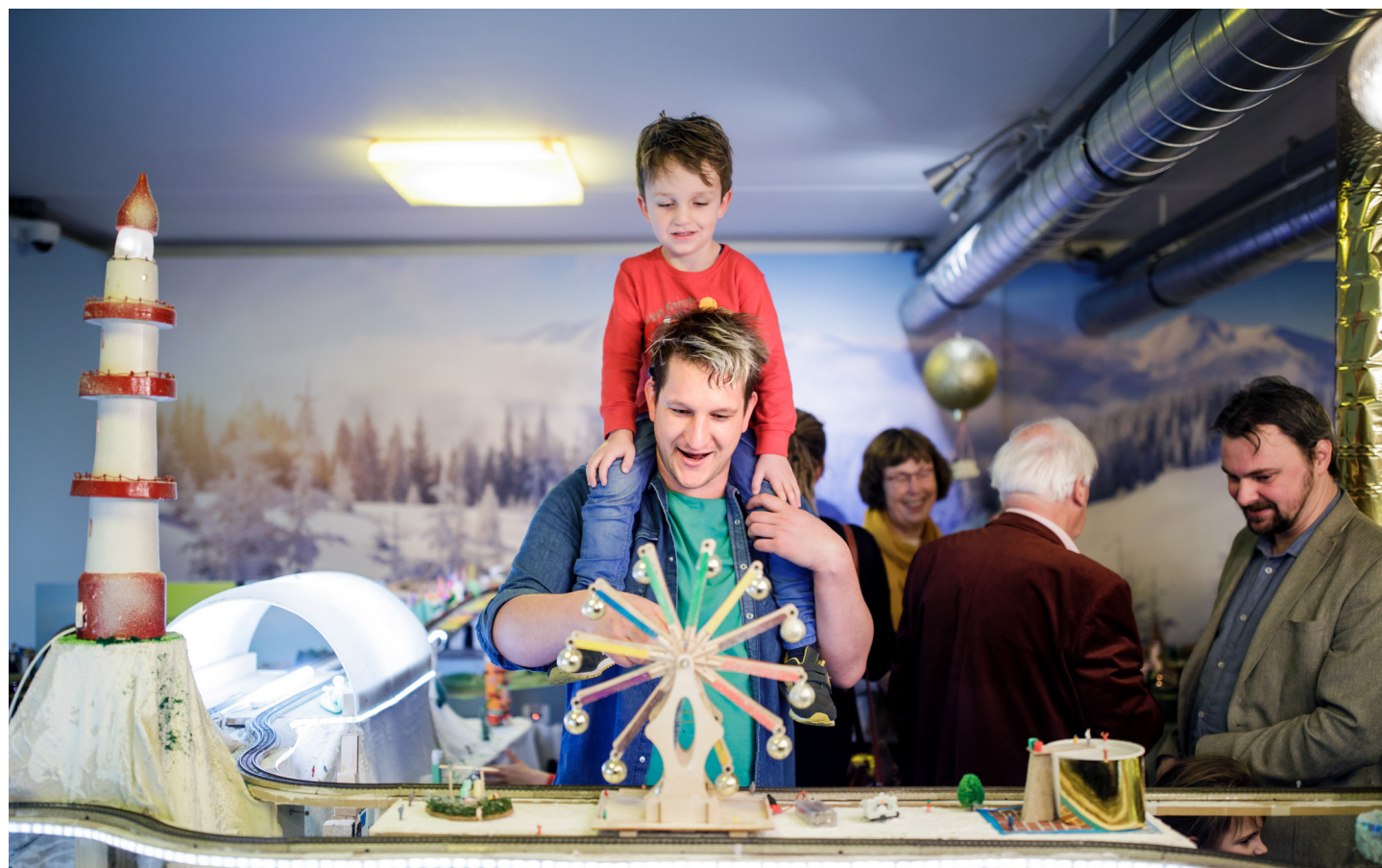
Modeltrein Kerstfestijn.