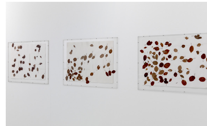
herman de vries, 1, 2 en 3 uur onder mijn appelboom, 1975, collectie Stedelijk Museum Schiedam

Het museum heeft in 2019 dankzij de subsidie van de gemeente, een bijdrage van het Mondriaan Fonds en steun van de Vereniging Rembrandt, de verzameling kunnen verrijken met 24 aankopen. Daarnaast zijn er particulieren die kunstwerken of historische voorwerpen aan het museum schenken. Zo zijn er in 2019 in totaal 35 nieuwe objecten in de collectie opgenomen: 9 daarvan werden geschonken, 2 in langdurig bruikleen gegeven en 24 stukken werden aangekocht (waarvan 6 voor de NOG Collectie).