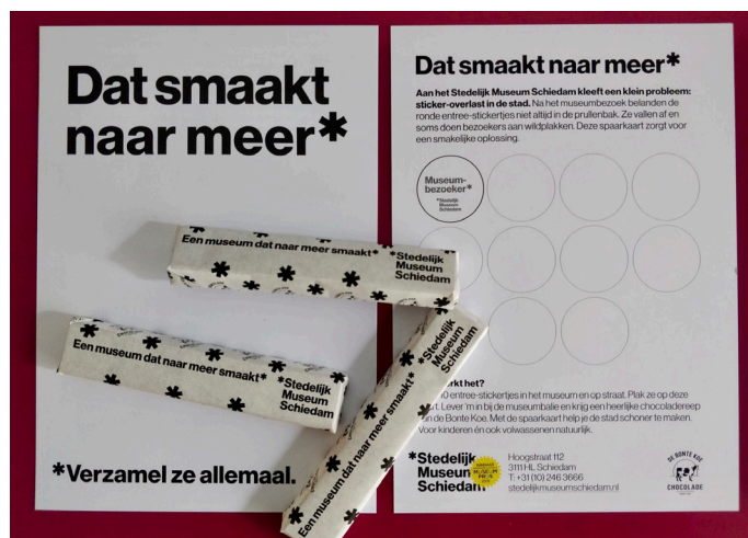
Chocoladerepen en spaarkaat.

Samen met chocolaterie De Bonte Koe bedacht het museum een heerlijke manier om de overlast van entreesticketjes op straat tegen te gaan: een spaarkaat. Wie daar tien gevonden entreesticketjes op plakt krijgt van ons een gratis chocoladereep. Het gezamenlijke initiatief helpt de stad schoner te houden. Bezoekers kunnen de chocoladereep ook kopen.