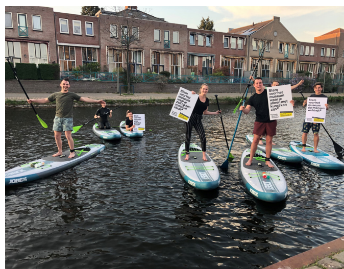
WhaSUP steunt ons