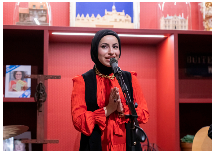
Zingen met Mona Haydar.

Rond de tentoonstelling Modest Fashion in het najaar vonden er nieuwe activiteiten plaats in het museum, van kimono's maken op zolder onder leiding van Anita de Groot tot een Meet & Greet inclusief mini-concert met de Amerikaanse rapper Mona Haydar en van een Modest Fashion Fair met modeshows tot een symposium in de Arminiuskerk in Rotterdam.