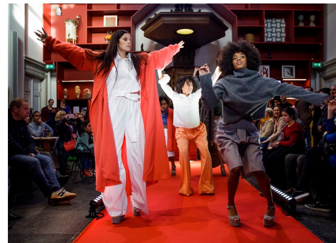
Modest Fashion Fair.