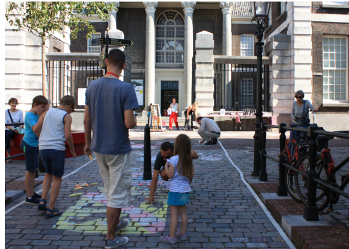
Grootste stoepkrijttekening van Schiedam.

van Schiedam. Ook werd er i.s.m. Centrum Management Schiedam en ondernemers op de Hoogstraat een boekje gemaakt met tips om te winkelen in de Hoogstraat. Dit boekje werd uitgedeeld aan alle museumbezoekers en was verkrijgbaar bij de ondernemers.