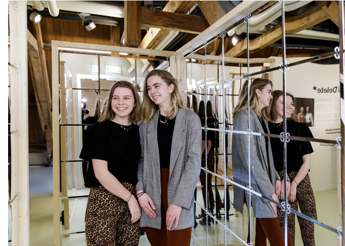
Isa en Lisa kozen werk uit voor de tentoonstelling Post/Delete .

Mijn Schiedam is dus inmiddels een jaar op weg. We hebben veel geëxperimenteerd en geleerd. We zijn onderdeel van de OF/BY/FOR ALL beweging.